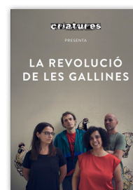
2019-2020 LA REVOLUCIÓ DE LES GALLINES Creació pròpia