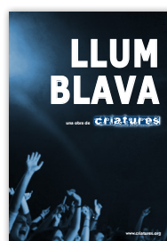
2014-2016 LLUM BLAVA Creació pròpia