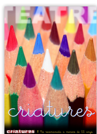
2009 CRIATURES varis autors

Direcció / Eloi Tres Il·luminació / Laia Casas Dramaturgia / Criatures, companyia de teatre